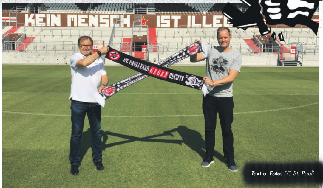
Text u. Foto: FC St. Pauli