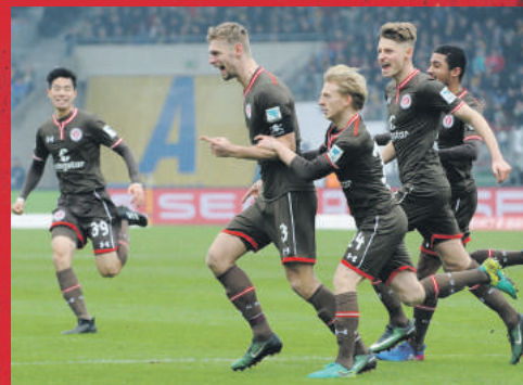
Text: Moritz Piehler