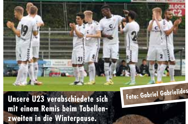
Unsere U23 verabschiedete sich mit einem Remis beim Tabellenzweiten in die Winterpause.

Eine ärgerliche Niederlage musste unsere U17 bei TeBe Berlin einstecken. Nach torloser erster Hälfte gingen die Hauptstadtler fünf Minuten nach dem Seitenwechsel in Führung (45.). Anschließend zeigten die Gastgeber, warum sie in der B-Junioren Bundesliga Nord/Nordost die drittbeste Abwehr stellen. Unsere Kiezkicker bissen sich an der lila-weißen Defensi-